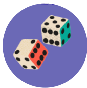
Jeux de société